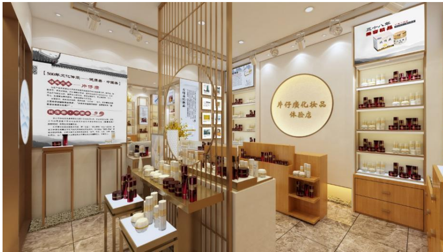
2. 历届（化妆品公司）美博会展馆效果图：