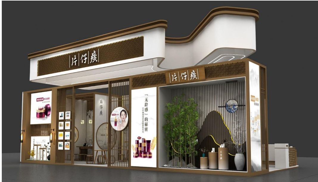
2023 年化妆品（美博会）展位设计